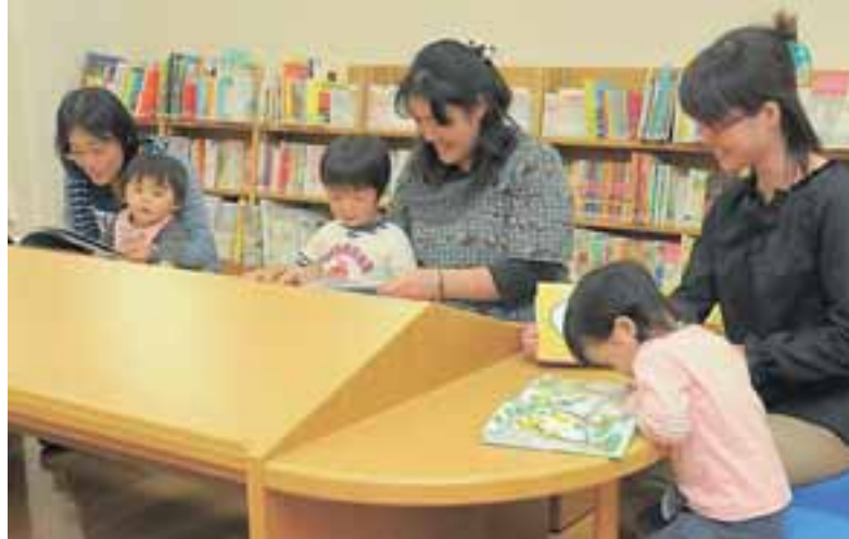
子ども向けの本もいっぱいあるよ