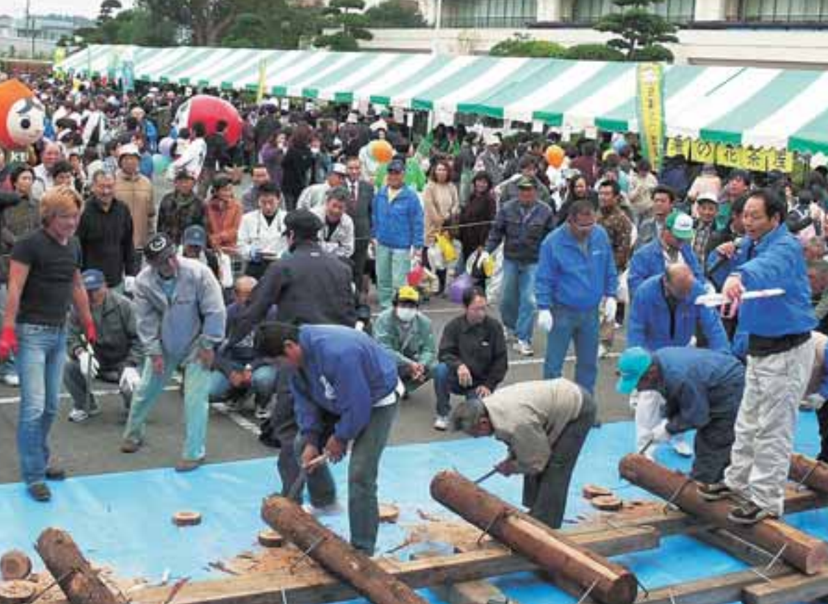
毎年恒例、丸太切り競争（昨年）