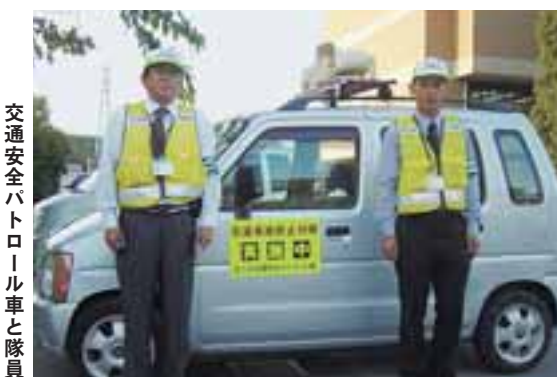
交通安全パトロール車と隊員