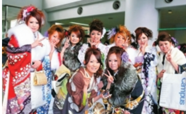
晴れて大人の仲間入り(昨年)

今年度は486名の皆さんが成人を迎えます。 詳しくは広報そうさ12月号19ページをご覧ください。 問生涯学習室 ☎67-1266