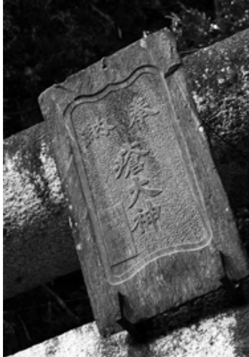
瘡大神の鳥居に掛かる表札

一年の始まりに、「初もうで」に出かけるようになったのはいつ頃からでしょうか。調べてみると、およそ350年ほど前から幕府の政策で民衆すべてが菩提寺（ぼだいじ）を持つことになり、寺院や神社との結びつきが強くなってからとされます。当時から寺の隣に神社がまつられることが多く、新年を迎え双方におまいりしたことが現代まで続いているのでしょうか。