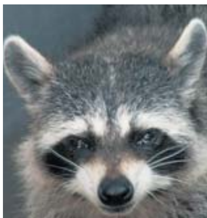
白い耳の縁とひげ

アライグマは、ペットとして飼育されていたのが、野生化して増えており、地域固有の生態系などに影響を及ぼす恐れがあります。平成17年6月には外来生物法に基づく特定外来生物に指定され、現在では個人でペットとして飼うには、環境省による許可が必要です。また、野外に放すことは禁止されています。