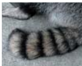
黒いしま模様のしっぽ