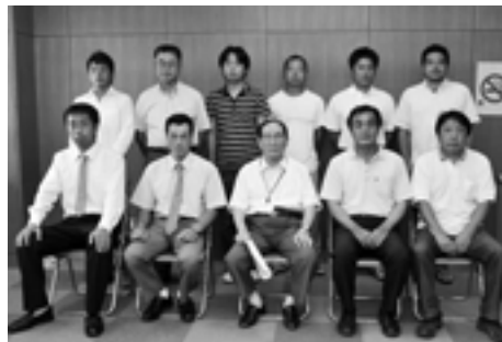
市長と新規に認定農業者となられた皆さん

農業経営の改善に意欲的な16経営体が新たに認定農業者として7月29日に江波戸市長から認定書の交付を受けました。今回の認定により、市内の