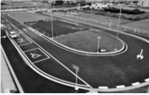
完成した駅南口広場