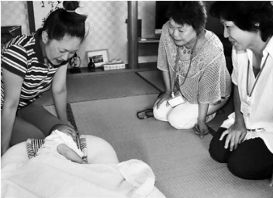
かわいらしい赤ちゃんを囲むと、訪問員との会話も自然に弾みます

子どもは地域の宝です。すべての子どもと子育て家庭を地域のみんで支えあつていくために「こんにちは赤ちゃん事業」が今年度から始まりました。 この事業は生後4か月未満の赤ちゃんのいる家庭に訪問員が伺い、子育てに関する相談や情報提供を行うなど、地域での育児支援を目的とした事業です。