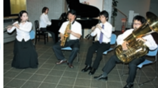
アンサンブル・パラディーソの皆さん

パラダイスと化した飯高檀林跡へ、ぜひお出でください。 日時...10月12日(日) 13:30~(予定) 場所...飯高寺(飯高檀林跡) 出演者...アンサンブル・パラディーソ 演目...「ニュー・シネマ・パラダイスよりメドレー」 「チャルダッシュ」「アヴェ・マリア」ほか 入場料...無料 匝瑳生涯学習室 ☎67-1266