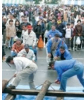
昨年の丸太切り競争

丸太切り競争といも掘り体験はまつり開始と同時にステージ隣の本部で参加者募集します! いも掘りは先着30名。みんな、急いで!