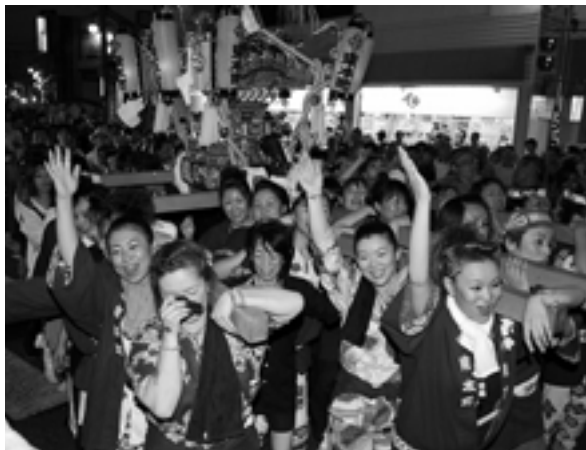
盛り上がる「女神輿渡御」

4日夕方から、全国でも珍しい、女性だけで神輿を担ぐ「女神輿渡御」が行われます。各町内から出た女神輿は、本町のタダヤ前に東から東本