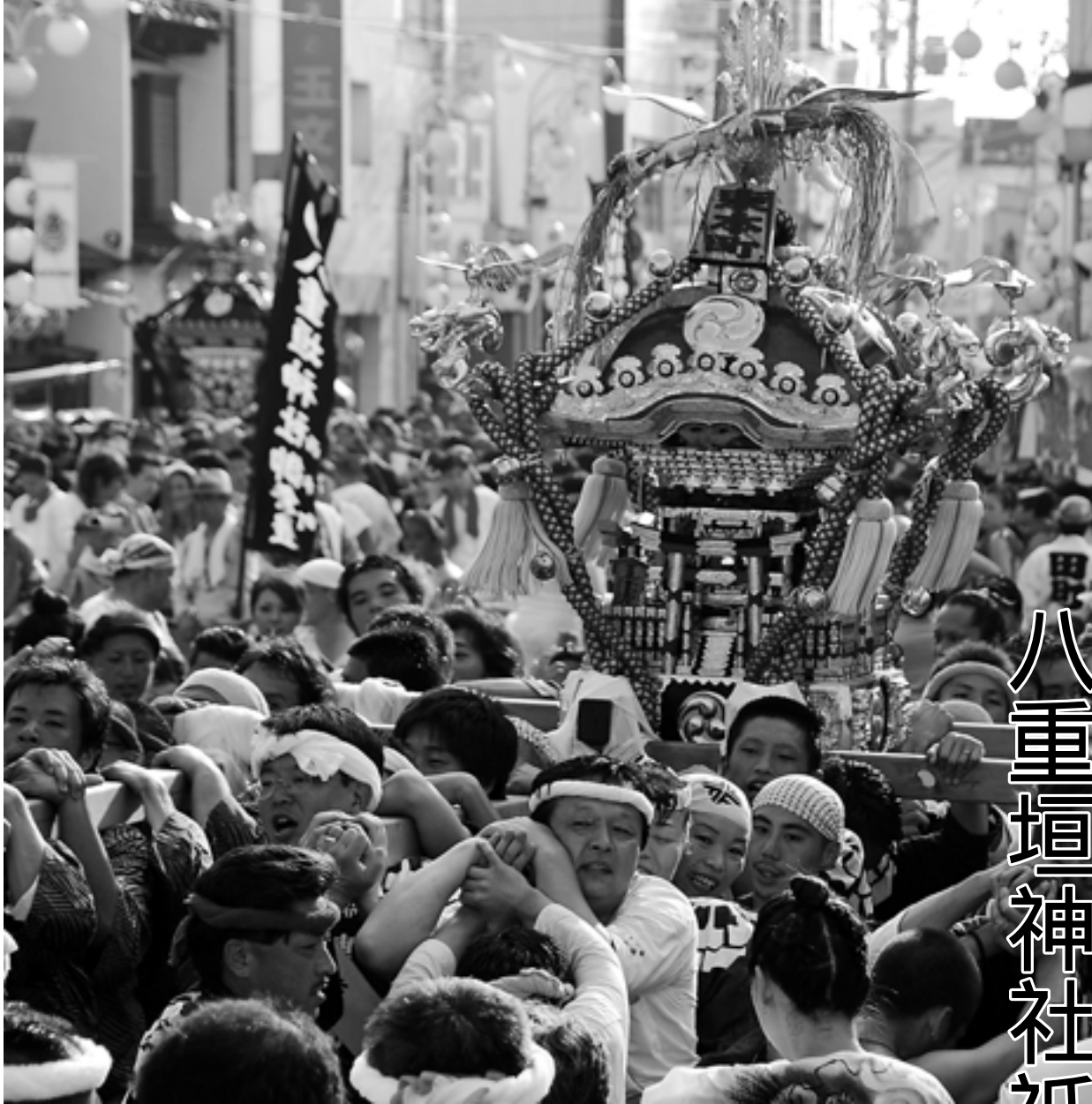
担ぎ手衆が全身全霊をぶつける5日の「神輿連合渡御」

匠瑳市の夏の一大行事、三百年の歴史を誇る八重垣神社祇園祭が今年も8月4日(月)・5日(火)に行われます。今年の年番町は東本町区。神輿 かみこし に加え、魅力ある催しを多数用意しました。 5日の「神輿連合渡御 かみこしれんごうとぎよ 」で、匠瑳の夏はさらにヒートアップします。