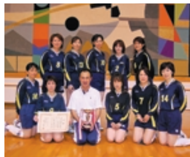
優勝した中央さつきクラブ