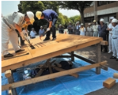
倒壊家屋からの救出訓練（中央地区筆部田）

参加者たちは、消火器の使い方や、初めて体験する倒壊家屋からの救出訓練にてこずりながらも、真剣な表情で訓練を行いました。