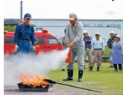
消火器による初期消火訓練（中央地区砂原）