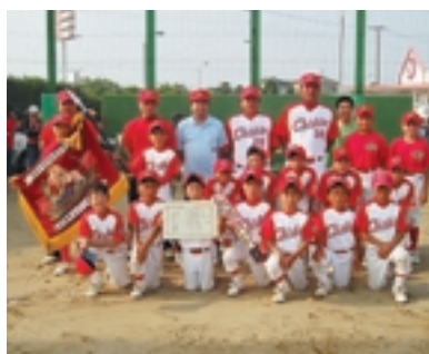
優勝した千潮スポーツ少年団

優勝：千潮スポーツ少年団 準優勝：共興スポーツ少年団 3位：豊和・須賀スポーツ少年団(連合)