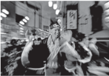
第9回フォトコンクール観光部門・金賞「HERO」