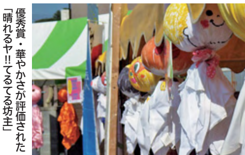
優秀賞・華やかさが評価された「晴れるヤ!!てるてる坊主」