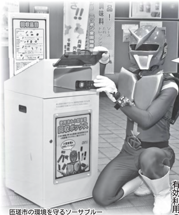
匝瑳市の環境を守るソーサブルー (ご当地ヒーロー・ソーサマン)

携帯電話やデジタルカメラなどの「小型家電」には、金などの貴金属や、「レアメタル」といわれる希少金属が含まれ、これらの有用な金属類を 活用するため、「小型家電リサイクル法」が昨年スタートしました。 本市でも、今年4月から回収を行っています。ごみの減量化、資源の有効利用のため、皆さんのご協力をお願いします。