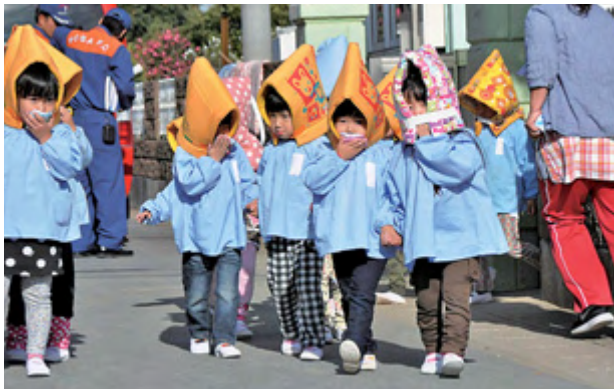
11月18日・須賀保育園(防災訓練)

日 13日(土) 受付 13時30分～13時40分 場所 のさかアリーナ 対象 乳幼児および就学前の親子 問 林 ☎090-4222-8491