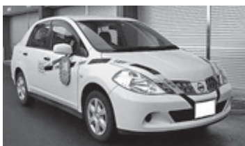
差し押さえた自動車の公示書が貼られた自動車

県は、自動車税の未納額の縮減のため、11月から3月までを滞納整理強化期間とし、給与・預金・自動車などの差し押さえを一層強化します。自動車税が未納の場合は、至急納付ください。