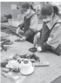
手作業による分解工程

回収された小型家電は、国の認定を受けた再資源化業者に持ち込まれ、分解・選別・精錬の工程を経て貴重な資源として生まれ変わり、新しい製品の材料となります。