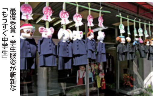
最優秀賞・学生服姿が斬新な「もうすぐ中学生」