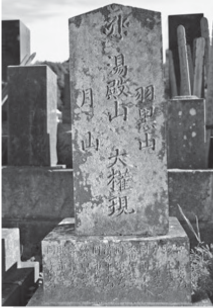
蓮花寺にたつ出羽三山供養塔

千葉県は、関東地方の中では出羽三山信仰が最も盛んな地域とされ、各地に結成された講の代表者が巡拝したとされています。 市内では調査の済んだ旧八日市場市域で、1781年から1863年までの間に12基の「出羽三山供養塔」が立てられたことが確認できます。