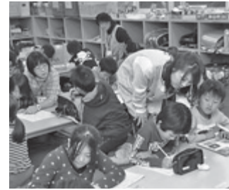
宿題を見るなど指導員は子どもたちの親代わり（八日市場児童クラブ）

※平成25～26年度に臨時職員登録済みの人も、改めて登録申請書の提出が必要です。