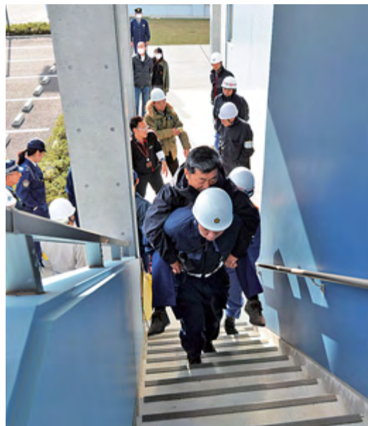
車椅子利用者を屋上へ避難させる(野菜中)