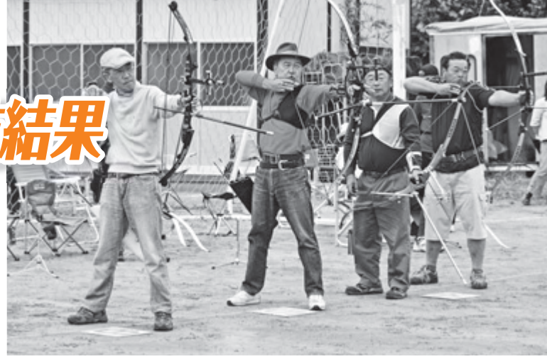
狙いを定めて(アーチェリー)