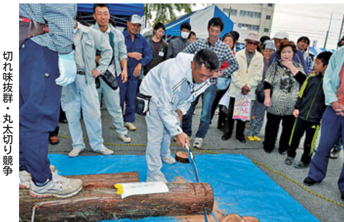
切れ味抜群・丸太切り競争