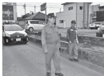
パトロール中の防犯指導員

市防犯協会では、12月中旬から「特別警戒」として、匝瑳警察署移動交番車との合同パトロール、夜間パトロールなどの防犯活動を強化実施します。