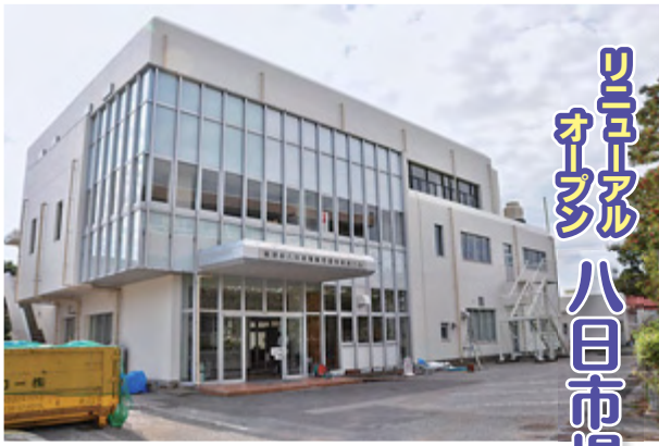
改修工事を行った八日市場勤労青少年ホーム