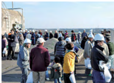
校舎屋上へ避難の様子(共興小・昨年)