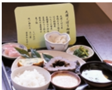
限定メニューの「大浦ごぼう御膳」この機会にぜひ

おいしんぼ定食、生姜焼き定食は特に人気メニューです。2月末までの土、日、祝日に限り、10食限定で季節限定料理「大浦ごぼう御膳」をご用意。ご家族おそろいでぜひ、ご賞味を!