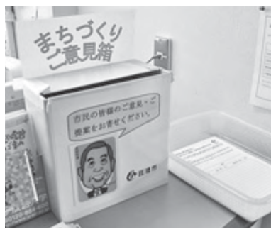
公民館に設置されたご意見箱