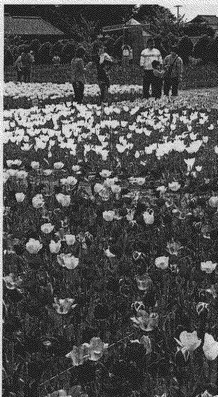
春には各色が咲き揃い、チューリップ祭りが開かれる匝瑳市野栄地区