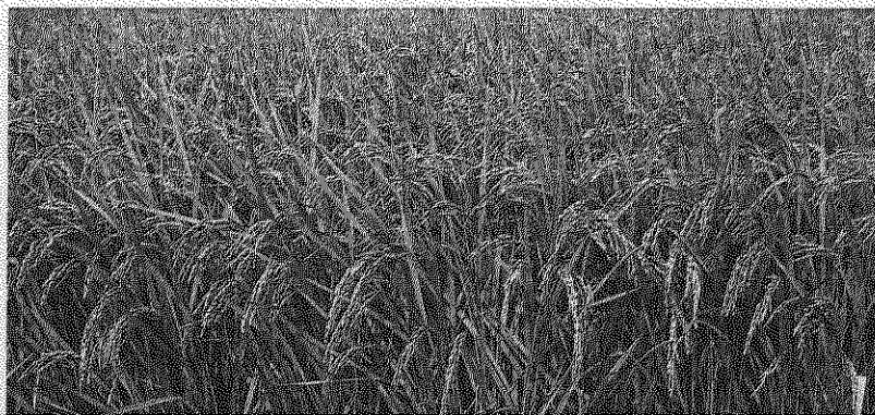
地区には広域の稲作地帯が広がる