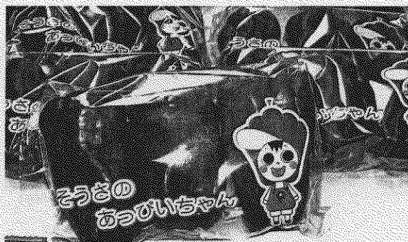
通常のピーマンに比べて甘み、栄養価とも高い特産の赤ピーマン。そうさ地区は関東で唯一の赤ピーマン産地