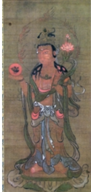
福善寺の「十二天像(日天)」