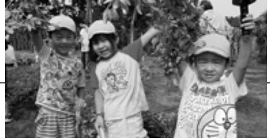
落花生採れたよ！（東保育園）