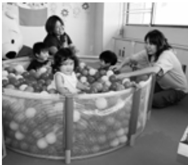
「つくし」で遊ぶの楽しいな

匠瑳市つどいの広場「つくし」 場所...野栄福祉センター 2階 日時...毎週月、水、金曜日（祝日、年末年始を除く）9時～12時、13時～16時 利用料...無料