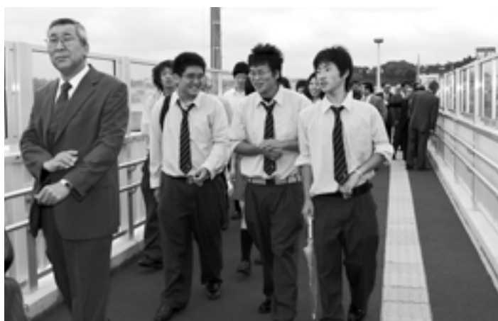
橋を渡る風の心地良さと 眺めの良さに思わず笑顔 がこぼれる