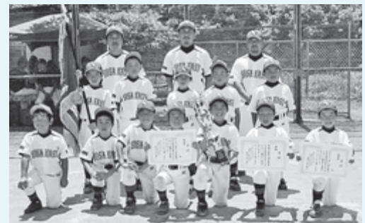
匝瑳東ベースボールクラブ