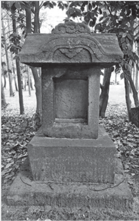
水神社にある石尊大権現の石宮

各地区にまつられる神社には本殿の祭神のほか、「阿波様」と呼ばれる「大杉大明神」（大杉神社・茨城県稲敷市）、「三峰大権現」（三峯神社・埼玉県秩父市）、「金毘羅大権現」（金刀比羅宮・香川県仲多度郡琴平町）などの石祠（石のほこら・石宮）を境内で目に