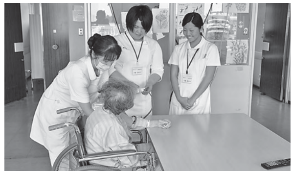
血圧測定は笑顔でコミュニケーション

市民病院とぬくもりの郷で5月29日、31日、6月4日の3日間、ふれあい看護体験が実施され、敬愛大学八日市場高校の生徒34人が参加しました。今回の体験内容は、血圧測定や車いすの移送介助、足浴ケア、入所者の話し相手などで、実際の看護業務の一部ですが、参加者は、少し緊張した表情ながらも看護師の仕事をごなしていました。