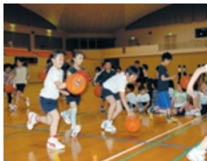
正確なボールさばきでドリブル！ (発団後の練習風景)