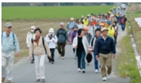
3月31日に行われた里山ハイキング。景色を楽しみながら歩く107人の参加者

週末は何かがある！ ふれあいパーク情報 GW期間中はイベント盛りだくさん 3日(6日)：各日先着300名の当日2千円以上お買い上げの方に花苗をプレゼント(レジで受け取ったレシートが引換券になりますので大切にしてください) 5日(こどもの日)：ソフトクリームをプレゼント(小学生以下のお友だち) 3日(6日)：ポン菓子販売 土・日・祝日のイベント：綿菓子の販売を開始します。どんどん焼き・けんちん汁と合わせてご賞味ください。