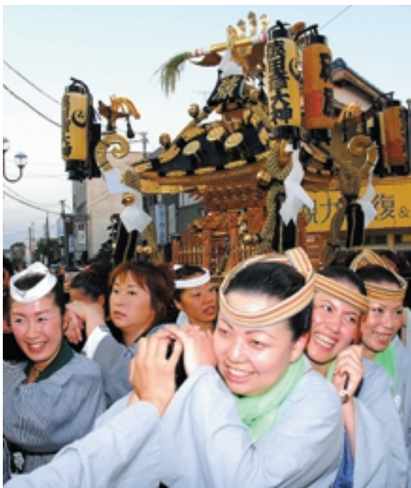
笑顔がこぼれる女神輿渡御