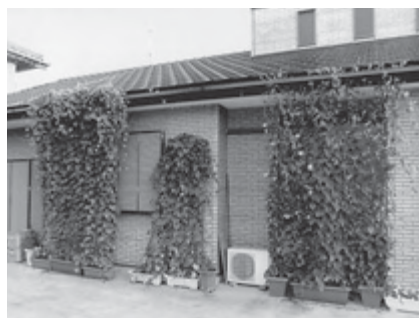
デザイン部門 椿簡易郵便局(椿海)

市では、家庭などにおける夏期の省エネルギーの取り組みとして、「緑のカーテン」の普及を推進するため、コンテストを実施しました。