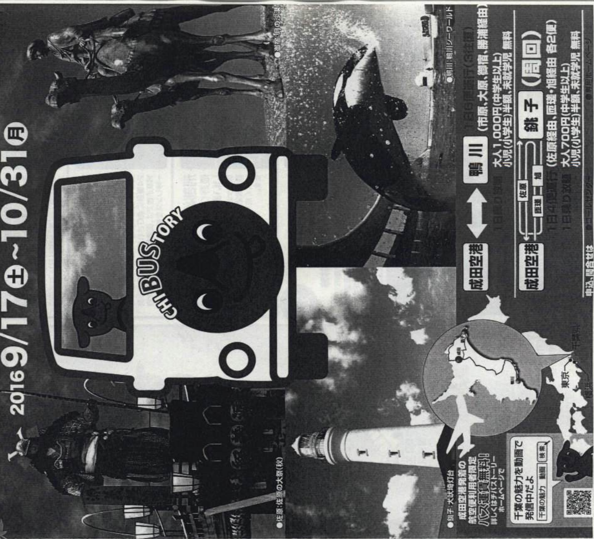
●佐原：佐原の大原(秋)