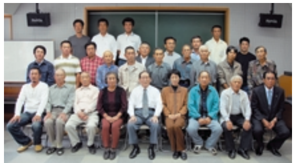
市長と新規に認定農業者になられた皆さん