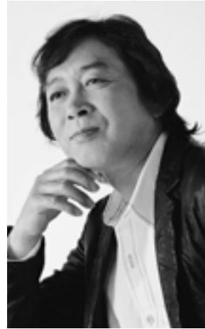
瀬川瑛子 <ゲスト> 新沼謙治