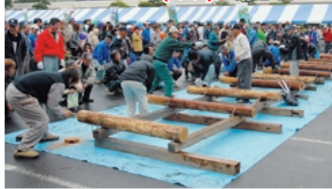
昨年の祭りの様子(丸太切り競争)