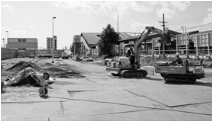
八日市場駅南口広場が整備され、南北の行き来が便利に

新市建設計画の着実な推進に向けて、保健や福祉、教育など市民生活に密着した分野に重点を置くとともに、都市基盤の整備や産業の振興などまちづくりの課題にも対応した予算の配分を行いました。