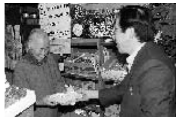
完成した弁当は民生委員によって届けられます

参加した推進員にお気持ちを伺ってみると、活動の中で一番やりがいを感じているそうです。民生委員を通して長年続けているこのサービスを高齢者が楽しみにしていることも伺いました。