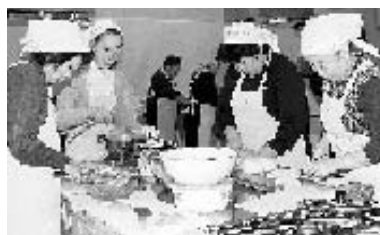
公民館で調理中の保健推進員

ービスを行っています。今回は、旧八日市場地区の保健推進員活動の様子を紹介します。当日、一人暮らし高齢者96世帯に昼食の温かい弁当を届けるために、朝8時過ぎから20人の保健推進員が公民館に集まって腕を振っていました。お昼近く、出来上がった弁当は同地区の民生委員に手渡され、対象の一人暮らし高齢者に届けられます。