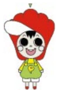
「すてきな名前を募集中」

募集締め切り：11月10日(金) 応募していただいた名前は1次選考の上、そうさ農業まつりでの市民の皆さんによる投票で決定させていただきます。