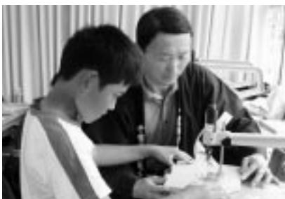
真剣な眼差しで、本棚作りに挑戦

次世代を担う若年者に、ものづくりの楽しさ、素晴らしさを知ってもらうための「手づくりみらい教室」が、10月3日(火)に豊和小で開催されました。5・6年生44人が5会場に分かれて、自分たちで希望した作品に挑戦。実技の講師はそれぞれの業種で【街の匠】と呼ばれる達人21人です。指導の結果、全員が満足した完成品を手に入れました。 協力団体...千葉県園芸装飾技能士会、千葉県左官業組合連合会、千葉県畳業組合連合会、千葉県板金工業組合、匝瑳市八日市場建築連合組合