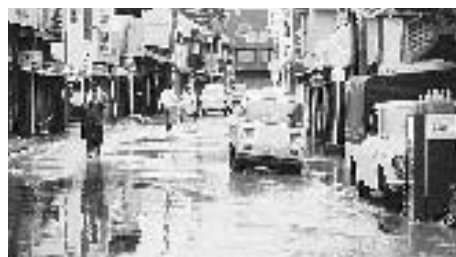
災害は突然襲ってくる(昭和46年の災害)