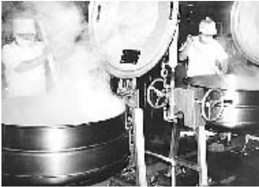
八日市場学校給食センターの作業風景

私たちの生活に欠かせない各種の公共施設。これまでにさまざまな分野で整備が進められました。これらの施設はとても身近なものなのに、案外「中に入ったことがない」、「何をしている施設か分からない」という人が多いものです。ましてや施設の規模、能力、内容なんて知らないのは当然のことです。また、匝瑳市になったことで新しい施設も増えました。 そこで市では、自分たちのお金（税金）で賄われているこれらの施設を理解していただくべく、団体を対象に「公共施設めぐり」を実施しています。どのような団体でも参加できます。20人（最大40人まで）ほど仲間が集まったら気軽に相談ください。勉強会や研修に小旅行気分でご利用いただけます。 〔実施要領〕 期日／時間：原則