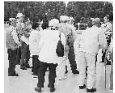
担当者の説明を受ける参加者

私たちの生活に欠かせない各種の公共施設。これまでにさまざまな分野で整備が進められました。これらの施設はとても身近なものなのに、案外「中に入ったことがない」、「何をしている施設か分からない」という人が多いものです。ましてや施設の規模、能力、内容なんて知らないのは当然のことです。また、匝瑳市になったことで新しい施設も増えました。 そこで市では、自分たちのお金（税金）で賄われているこれらの施設を理解していただくべく、団体を対象に「公共施設めぐり」を実施しています。どのような団体でも参加できます。20人（最大40人まで）ほど仲間が集まったら気軽に相談ください。勉強会や研修に小旅行気分でご利用いただけます。 〔実施要領〕 期日／時間：原則