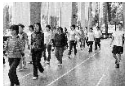
健康づくりのための運動研修