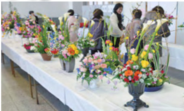
楽しいコーナーがいっぱい(昨年)