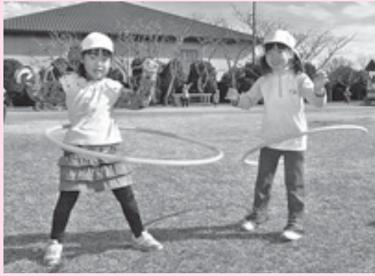
1月23日・のさか幼稚園