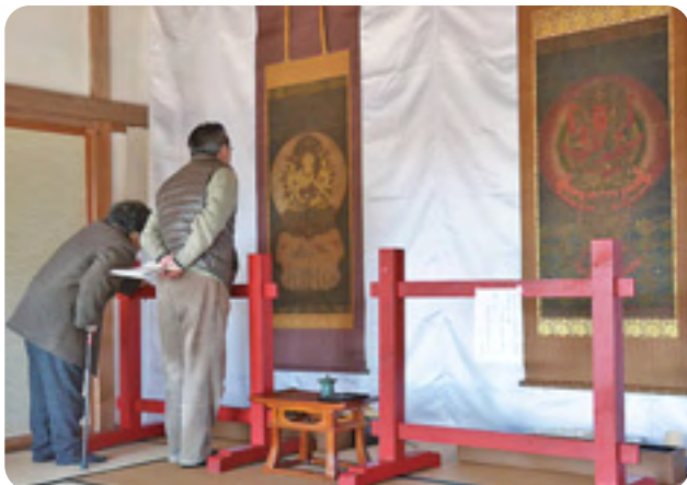
長徳寺で仏画に見入る来場者たち

国指定重要文化財「愛染明王像」 あいぜんみょうおうぞう 「普賢延命菩薩像」 ふげんえんめいぼまつぞう の2幅が公開された長徳寺（須賀地区）では、朝10時の公開とともに大勢の人が訪れ、鎌倉時代後期の作と伝わる仏画の細やかな切金技法と鮮やかな色彩に目を奪われていました。