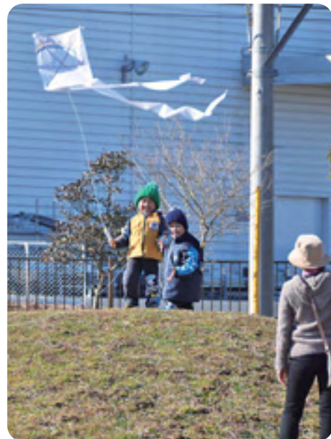
たこ揚げを楽しむ親子