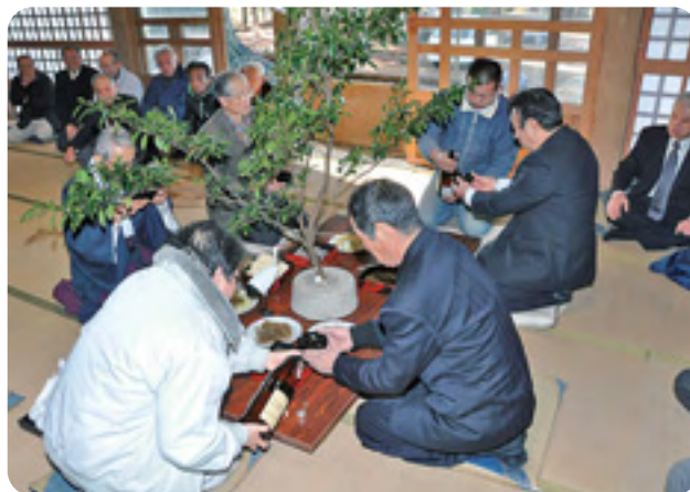
神事を終え神酒をいただく参加者たち