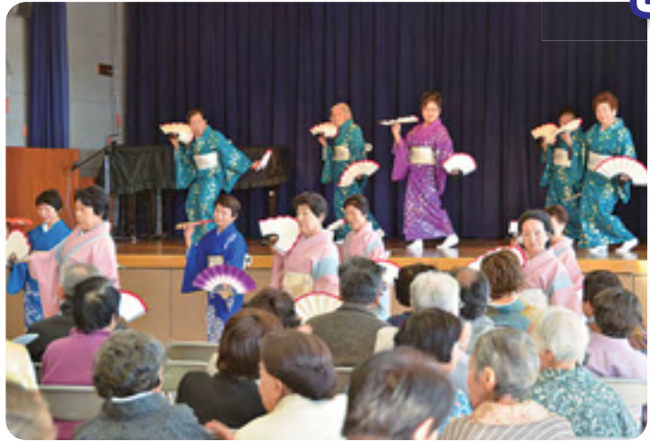
舞踊「祝いの舞」を披露

これは昨年6月にスタートした同大学の「生きがい講座」で、詩吟やカラオケ、舞踊、民謡、社交ダンスなどを学んだ受講生たちが、その練習の成果を発表する場となるもの。舞台上に登場した受講生たちが、練習の成果を見事に披露すると、指導してきた講師や他の受講生などから多くの拍手が送られました。