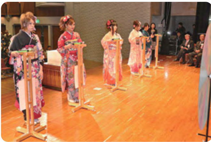
色鮮やかな着姿で的を狙う新成人たち