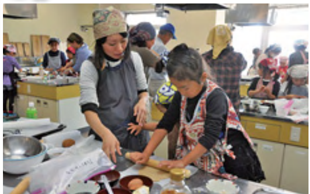
上手にできるかな？(昨年)

市内でとれたおいしい素材で、おやつを作りませんか？小麦やいちごがどのようにして栽培されたのか。生産者から直接お話を聞きながら、楽しくおやつを作りましょう。