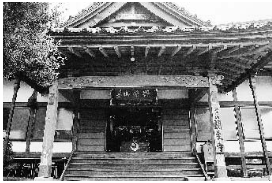
日朗ゆかりの寺、朗生寺（野田地区野手）

同時期の日蓮の有力な信者には、金原法橋（かなばらほつきよ）（かなばらほつきよ）という金原（飯高地区）地域の領主もいて活動の足跡を残しています。 日朗の活動の中心は当時幕府のあった鎌倉で、76歳で亡くなった後もその一門の流れが発展したため、その名が広く知られるようになりました。 市内に残る日朗関係の遺跡は、内山新田（豊和地区）に1748年（寛延元年）の供養塔、1859年（安政6年）に飯高村周辺数十か村の信者が立てた供養塔（飯高地区金原）があります。朗生寺には1723年（享保8）日朗400遠忌（おんき・年忌）供養塔が日顛（にちぎ）によって建てられました。日顛は木積（きづみ・豊栄地区）の生まれで飯高檀林に学んでおり、日朗の功績をしのび、朗生寺にも深くかかわったのでしょう。 日朗より3、40年おくらせて活動したのが弘智（1281年～1363年）で、大浦（匠瑳地区）生まれで、ゆかりの寺は蓮花寺です。 弘智は600年ほど前に即身仏（そくしんぶつ・ミイラ）となり、近年出版された本でも、「日本一有名な即身仏」として紹介されています。 弘智の即身仏は日本海を望む新潟県の寺にまつられています。昭和30年代の本格的な調査で、日本最古の即身仏とされました。有名になったのは、300年ほど前から松尾芭蕉や文人墨客が同寺に立ちより見ていることで、紀行文などに載せられたためです。蓮花寺には弘智の木像があり、新潟県周辺からも一行が同寺をたずねて来たことがあります。