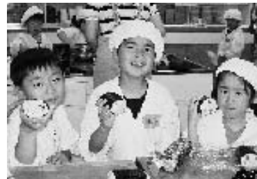
大巻き寿司を手に笑顔の子どもたち(調理実習)

教えて料理への興味をなくさないようにしたい。」「紙芝居がとてもわかりやすい内容であった。」「子供たちもなかなか上手で、お家でもお手伝いしてもらおうと思います。」