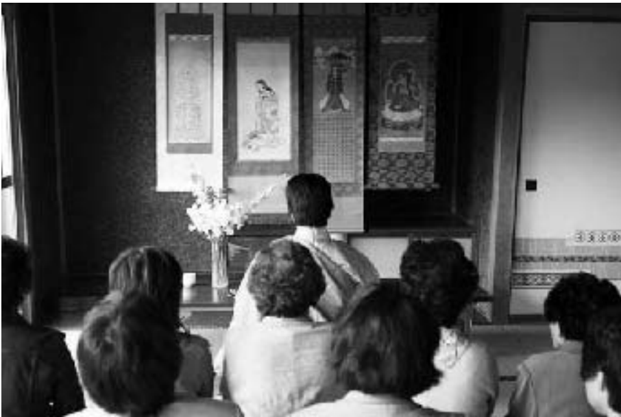
修復された掛け軸を前に、お経をあげる女性たち

す。女性による講(こう・信仰集団)は安産・子授け・子育てなどを願う「子安講」が中心で、カミやホトケの縁日にあたる十三日、十五日、十九日、二十三日などに行われることから「ジユウクヤ講」「オサンヤサマ」などと呼ばれています。新地区では集会所ができるまでは、地区内の当番の家をめぐって行われていたそうです。