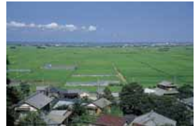
干潟八万石の広大な田園

地域西側の丘陵地は、低地部に借当川流域の田園が広がり、丘陵地に里山と住宅地・集落地が分布しています。東側の田園では、干潟八万石の広大な水田と住宅地・集落地が分布しています。