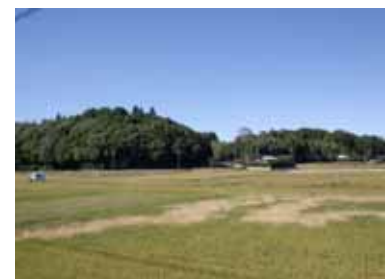
丘陵地に広がる里山

谷津田や里山の豊かな自然資源や景観の保全・活用に努め、住宅地や集落地と調和したやすらぎのある空間の創出を図ります。