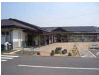
ふれあいパーク八日市場

都市活動軸の国道296号及び地域拠点間連携軸の主要地方道佐原八日市場線の沿道は、地域特性に応じた沿道景観づくりを推進します。