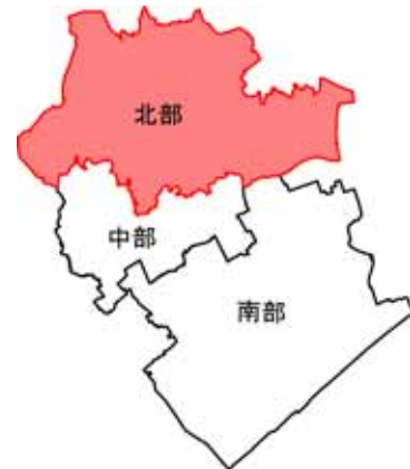
図 北部地域の位置