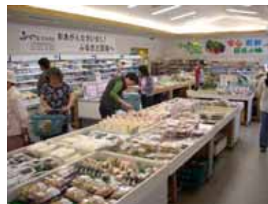
ふれあいパーク八日市場