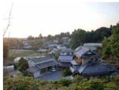
丘陵地に点在する集落

住宅地や集落地における身近な生活環境の改善 がけ崩れや浸水に対する防災対策 污水处理施設の普及促進