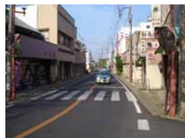
旧国道沿いの商店街