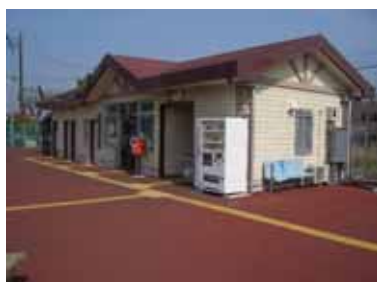
J R 飯倉駅