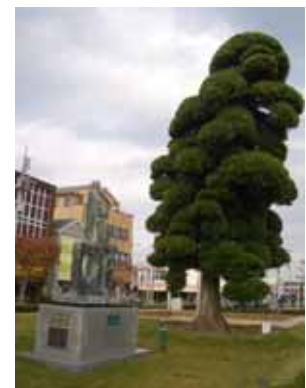
八日市場駅前のモニュメント 及びシンボルツリー

地域北側の丘陵地では、地形的に変化の富んだ里山や谷津田の美しい自然景観が形成されています。また、地域南側では、優良な田園景観が形成されています。