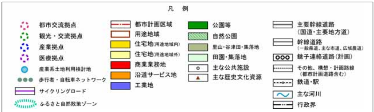
図 中部地域のまちづくり方針