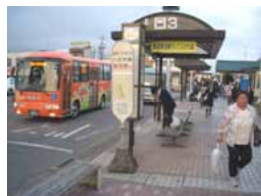
J R 八日市場駅前高速バス乗り場 （左は市内循環バス）

駅や駅周辺の交通施設におけるバリアフリー化の促進と安心安全な歩行者・自転車環境の創出