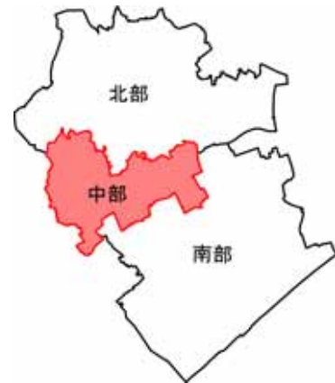
図 中部地域の位置

地域の西側から銚子連絡道路の延伸が計画されています。また、地域の南側を大利根用水が東西に流れています。