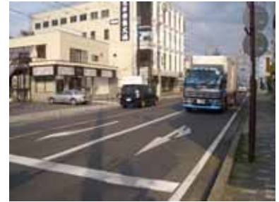
交通量の多い国道 126 号

銚子連絡道路の延伸による（仮称）八日市場 IC の整備を生かし、高速交通体系の強化による市外交流の活性化を図ります。中心部の道路ネットワークの形成や混雑解消に向けて、市街地（用途地域）を中心に計画される都市計画道路の着実な整備を進めます。また、長期間未整備な路線については、今後の社会情勢の見通しや交通量の予測などを踏まえ、必要に応じて路線の見直しを行います。