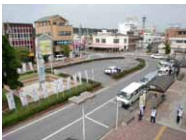
J R 八日市場駅前広場

市民病院周辺地区は、医療・福祉施設の集積を生かした医療拠点として、医療・福祉機能の充実に努めるとともに、より利用しやすい環境づくりに向けて、循環バス等による交通ネットワークの充実を図ります。