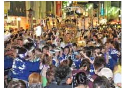
八重垣神社祇園祭

旧国道沿いには、歴史的建築物が分布し「 いち 市」で栄えた面影が残されています。また、八重垣神社祇園祭やよかつべ祭りに代表される歴史と伝統を伝える祭りが受け継がれています。