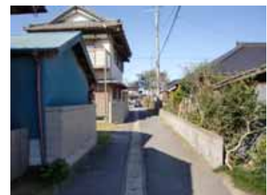
住宅地内の狭あいな生活道路

点在する住宅地や集落地では、狭あいな生活道路の改善や浸水対策の必要な地区がみられます。