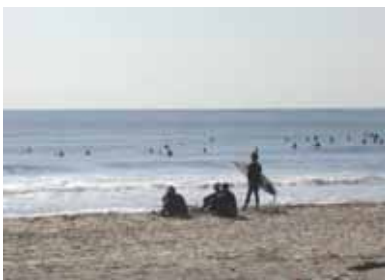
九十九里浜 (野手浜海岸)