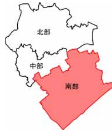
図 南部地域の位置