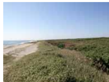
九十九里浜 (野手浜海岸(左)と松林(右))