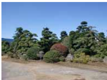
道路沿いの造形庭園

九十九里浜沿いにサイクリングロードの整備を推進し、周辺自治体との連携を進め、海浜部の美しい景観を生かした観光拠点としての充実を推進します。また、海浜部と市内の観光資源を結び、快適で安全に歩いたり自転車で巡ることができるように歩行者・自転車ネットワークの形成を目指します。