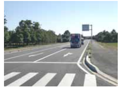
主要地方道 八日市場野栄線 (野栄バイパス)

公共交通機関は、市内循環バスが3路線運行しており、地域住民の日常生活の移動手段として機能していますが、利用者はやや減少傾向がみられます。