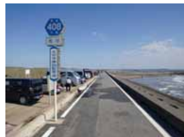
サイクリングロード (一般県道飯岡九十九里自転車道)