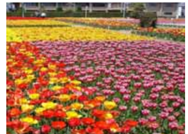
チューリップ祭り