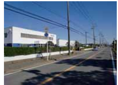
みどり平工業団地

都市活動軸の主要地方道八日市場野栄線の沿道は、八日市場駅周辺の市街地と海浜部を結ぶ主要軸として、地域特性に応じた沿道景観づくりを推進します。