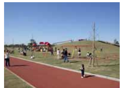
野栄ふれあい公園