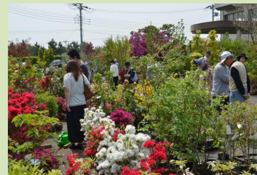
匠瑛市植木まつり

近年では植木はクレーンを使いコンテナに積み込まれ、海外へ輸出されています。海外販路の拡大や普及展開を国際的に推進するため、国や県など関係機関に対する情報発信を行っています。また、海外向けの新商品開発や販路拡大への直接的な支援も行っています。