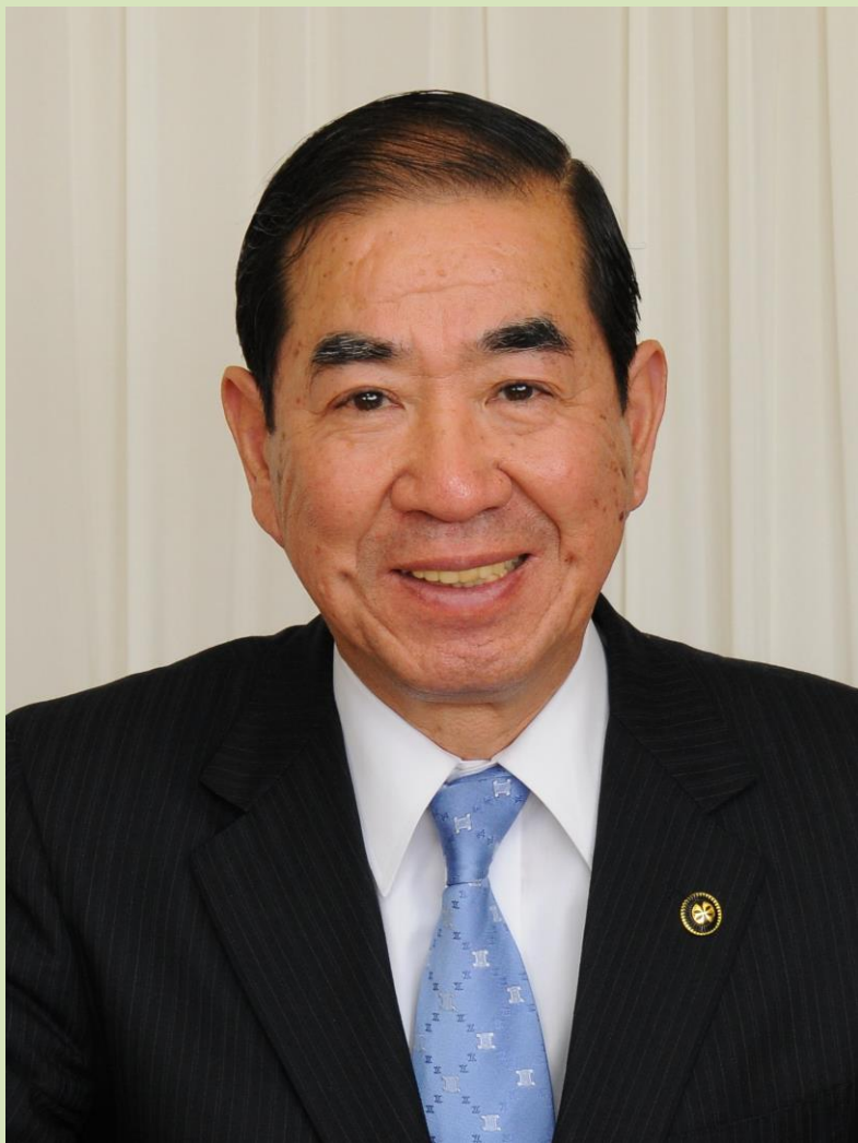
おおた やすのり 匠瑛市長 太田 安規