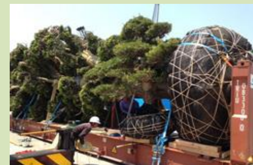
コンテナに積み込む様子