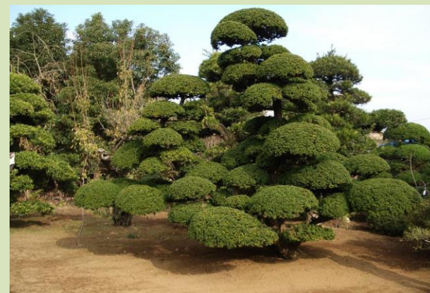
イヌマキの造形美