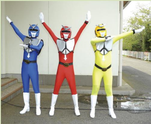
ご当地ヒーロー ハリキリ戦隊ソーサマン

最近ではその難読さを逆手に取り、「読めない、書けない、どこにある」をキャッチフレーズにして、多くの人に匝瑳市を知っていただけるよう活動をしています。