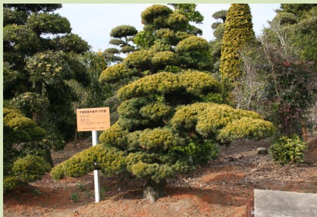
銘木100選に選ばれた植木