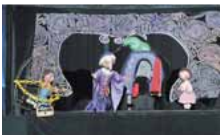
子ども人形劇「ヘンゼルとグレーテル」（昨年）

時間 … 11時～ ふれあいセンター 「ばんはこころ」 入場料… 無料 作品 … 市民 同生涯学習室 ☎67・1266