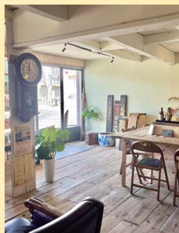
「ぐるり」の入口には、思い出の古道具が持ち込まれている

一方、古本以外にも、火鉢や籠、掛け時計など、その家々の思い出の詰まった「古道具」が寄付で持ち込まれることが増えています。地域の皆さんの物を大切に、大事にする気持ちに気づき、心が温かくなります。