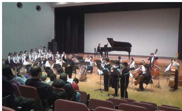
演奏を披露するUFOら

コンサートは例年開催されていますが、今回のコンサートは能登半島地震の被災地の復興を願い開催。当日集まった募金9万3966円が被災地へ送られました。