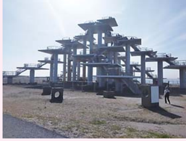
▲東京湾を一望できる展望塔

手付かずの自然が多く残された富津公園(富津市)内の約7kmのコースを歩きます。道中には東京湾を一望できる展望塔や軍事遺跡などがあります。