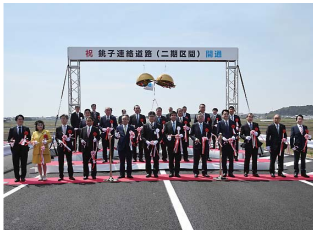
テープカットを行った地元首長・国会議員ら

その後、匝瑳インターチェンジに移動しセレモニーが行われ、テープカットやくす玉開披などで開通を祝いました。