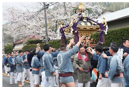
桜の下で神輿を担ぐ参加者

中央地区八日市場ホ・米倉区の葦茅神社で4月7日、地区に春の訪れを告げる祭礼が行われました。