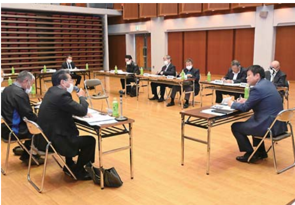
まちづくり懇談会の様子（令和5年）

開催日・時間は、団体の希望する日（年末年始を除く）の10時から21時までの間の2時間以内とします。