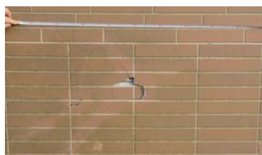
陥没した野栄ふれあい公園のトイレ棟外壁