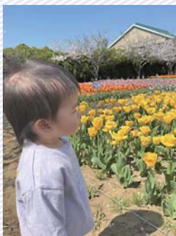
◀SNS部門市長賞受賞作品 アカウント名@r_jiujuan 撮影場所…のさか花の広場

「第19回匝瑳市フォトコンクール」(市観光協会主催)が開催され、応募総数155点の中から、一般部門・SNS部門それぞれの入賞者が決定しました。