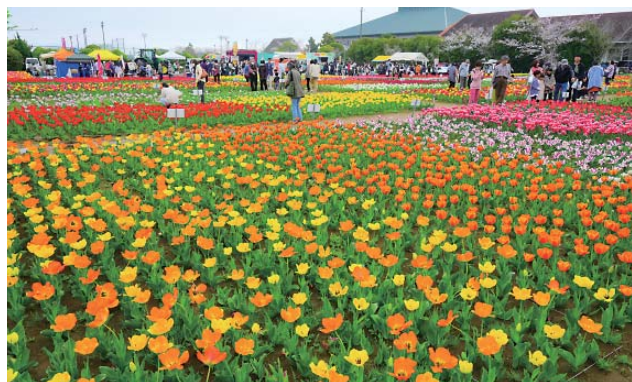
来場者でにぎわう会場（7日）