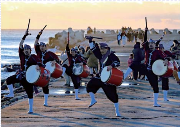
▲一般部門金賞受賞作品 「24の幕開け」 撮影場所…野手浜